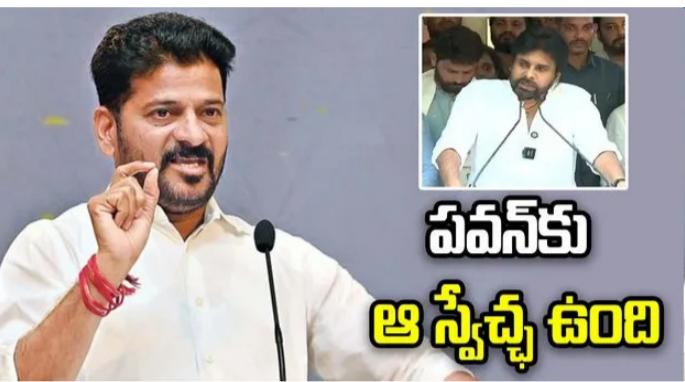
పవన్ కు ఆ స్వేచ్ఛ ఉంది

న్యూఢిల్లీ, అమృత్ తెలంగాణ: తెలంగాణకు వచ్చేందుకు.. వెళ్లేందుకు.. పోటీ చేసేందుకు.. ఆంధ్రప్రదేశ్ డిప్యూటీ సీఎం, జనసేన పార్టీ అధినేత పవన్ కల్యాణ్ కు పూర్తి స్వేచ్ఛ ఉందని ముఖ్యమంత్రి రేవంత్ రెడ్డి స్పష్టం చేశారు. శుక్రవారం న్యూఢిల్లీ పర్యటనలో ఉన్న సీఎం రేవంత్ రెడ్డి మీడియాతో ఇష్టాగోష్ఠిగా మాట్లాడారు. ప్రజలకు వ్యతిరేకంగా మాట్లాడినందునే.. పవన్ కల్యాణ్ పై తమ మంత్రులు మాట్లాడారన్నారు. తనకు హిట్టర్ ఆదర్శం అని తానెప్పుడూ చెప్పలేదని స్పష్టం చేశారు. ప్రజాస్వామ్యంలో ఉన్నవారు ఎవరైనా.. హిట్టర్ తమకు ఆదర్శం అని చెబుతారా? అని ప్రశ్నించారు. పార్టీ అధిష్ఠానంతో జరిగిన సమావేశంలో మంత్రివర్గ విస్తరణపై చర్చ జరగలేదని చెప్పారు.