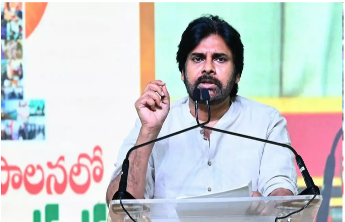
అభిప్రాయపడుతున్నారు. రాష్ట్రాలు తమ అంతర్గత విభేదాలను, సంచలిత భావాలను పక్కనబెట్టి, మనమంతా ఒకటే అనే ‘భారతీయత’ వైపు అడుగులు వేసినప్పుడే అసలైన ప్రగతి సాధ్యమవుతుందన్న పవన్ కల్యాణ్ విలుపుపై ప్రస్తుతం రెండు రాష్ట్రాల్లో భిన్న కోణాల్లో చర్చ జరుగుతోంది.

అమరావతి, అమృత్ తెలంగాణ: ఆంధ్రప్రదేశ్ డిప్యూటీ సీఎం, జనసేన అధినేత పవన్ కల్యాణ్ తెలుగు రాష్ట్రాల సామాజిక, రాజకీయ పరిస్థితులపై చేసిన సరికొత్త వ్యాఖ్యలు ఇప్పుడు ఉమ్మడి రాష్ట్రాల్లో తీవ్ర చర్చకు దారితీస్తున్నాయి. తిరుపతిలో జరిగిన ఒక బహిరంగ సభ వేదికగా ఆయన ఆంధ్రప్రదేశ్, తెలంగాణ రాష్ట్రాల భవిష్యత్తు మరియు అభివృద్ధిపై కీలకమైన విశ్లేషణ చేశారు. తెలుగు రాష్ట్రాలు రెండు కూడా దేశంలోనే మరింత శక్తివంతంగా ఎదుగాలంటే, ఇప్పటివరకు ఉన్న కొన్ని సంచలిత పరిమితులను దాటాల్సిన అవసరం ఉందని ఆయన అభిప్రాయపడ్డారు. ఈ క్రమంలోనే “ఒక రాష్ట్రం కులాల పరిమితులు దాటాలి, మరొక రాష్ట్రం ప్రాంతీయత పరిమితులు దాటాలి” అంటూ పవన్ కల్యాణ్ చేసిన వ్యాఖ్యలు ఉభయ రాష్ట్రాల రాజకీయ, సామాజిక పర్సాల్లో ఆసక్తికరమైన చర్చను లేవనెత్తాయి. నెటిజన్లు భిన్నాభిప్రాయాలు